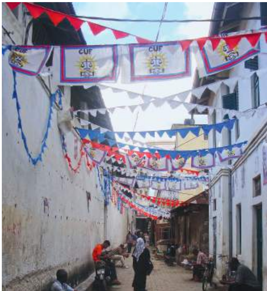
Флаги партии КУФ в одном из городских кварталов. Ноябрь 2015

в агитационную площадку. Флаги партий в огромных количествах вывешиваются на улицах, зданиях, электрических столбах вдоль дорог и шоссе. Это могут быть полотна больших, средних и малых размеров с полным либо сокращенным набором символов. Растяжки с маленькими флажками или окрашенными в цвета партий (желто-зеленый и бело-сине-красный) треугольными вымпелами крепятся через каждые несколько метров над головами прохожих на узких