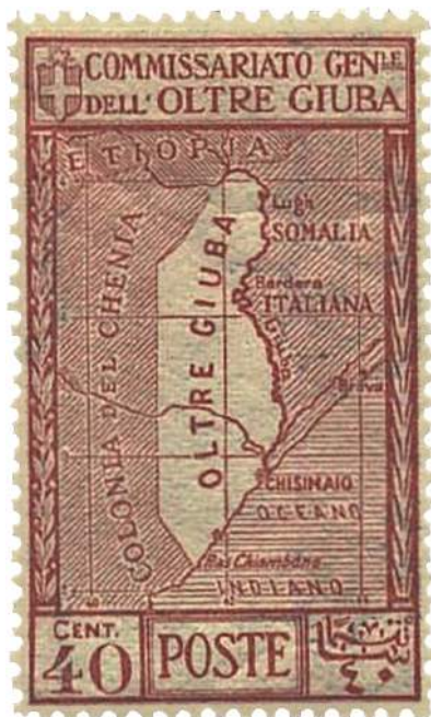
Исторические границы Джубаленда

на территорию исторического Джубаленда (области Сомали, которая была передана Италии из состава Британской Кении и существовала как отдельная колония в 1925–1926 годах).