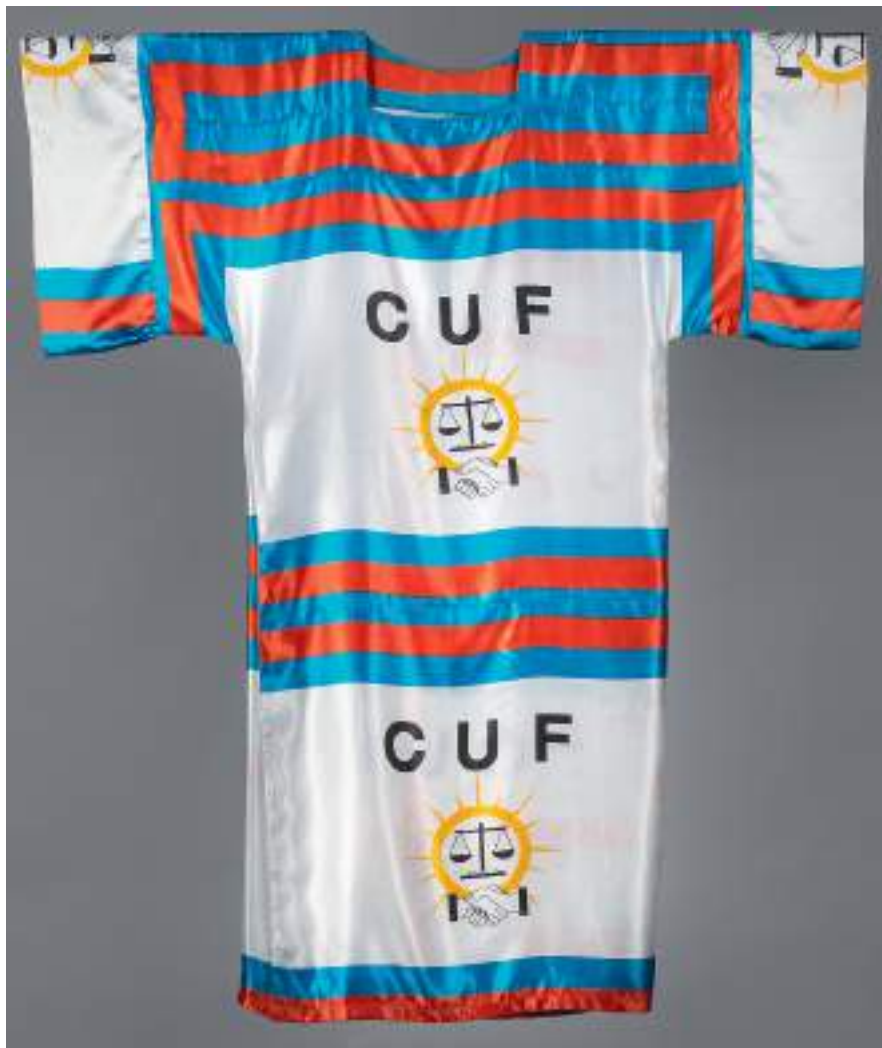
Агитационное платье активистки партии КУФ Государственный Эрмитаж

цветовая символика их партии совпадает с российским триколором. В результате одна из женщин-активисток предложила, помимо собственно флага, свое агитационное платье, сшитое из знамен, и воздушные шары с портретом кандидата в президенты от КУФ Муалима Сейфа Шерифа Хамада.