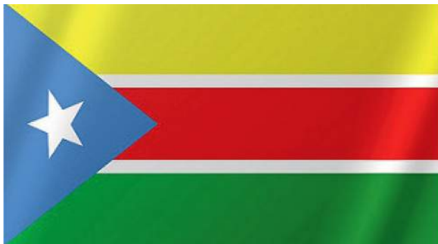
Флаг Джубаленда, провозглашенного в 2012 году в Колумбусе, штат Огайо, США