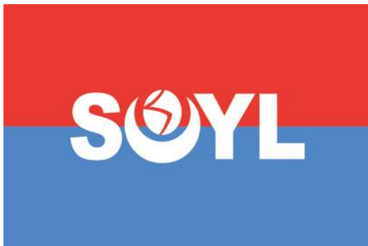
Флаг Лиги сомалийской молодежи

триколор? Одно из возможных объяснений связано с традиционными цветами первой политической партии страны – Лиги сомалийской молодежи. Согласно воспоминаниям одного из ее основателей, первоначально Лига собиралась использовать красный флаг, но британские колониальные власти отказались его регистрировать. Тогда были объединены цвета двух клубов – красный и синий (точнее, голубой) 5 . В центральной части флага было помещено сокращенное название и символы Лиги, выполненные белым цветом.