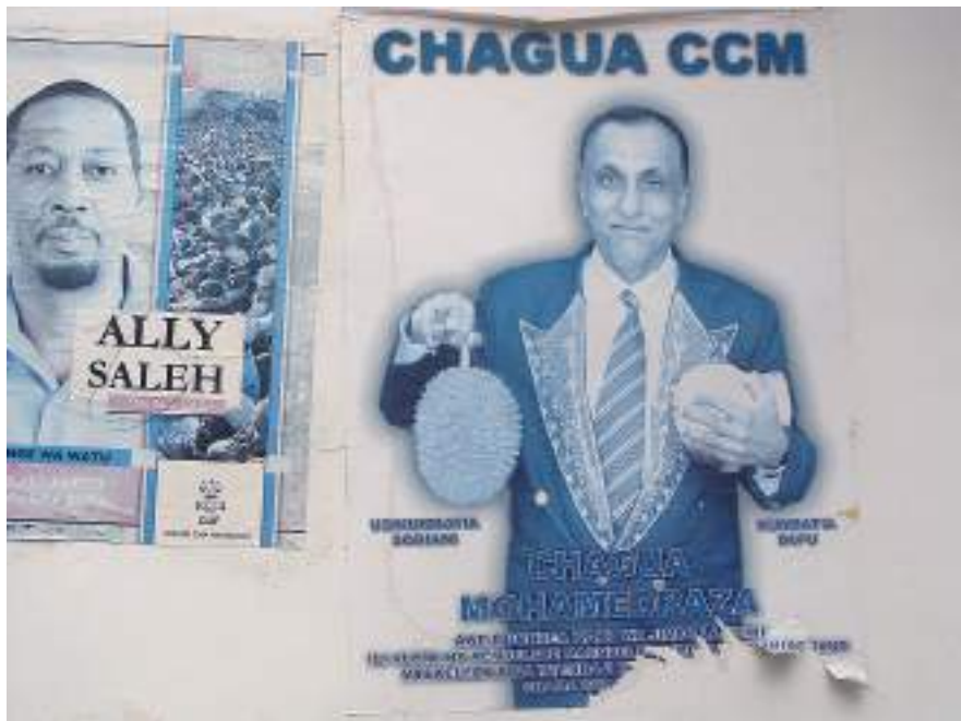
Плакат партии ЧЧМ. Ноябрь 2015

Даже в периоды политического затишья геральдическую символику двух партий можно повсеместно увидеть на Занзибаре в городской и сельской местности. Флаги партий развеваются у входов в здания либо посреди специально оборудованных площадок, где происходят заседания деревенских, районных и окружных ячеек партий. Стены домов пестрят выцветшими от времени агитационными плакатами ЧЧМ и КУФ со всех предыдущих выборов – президентских, парламентских и в местные органы правления. Постоянно обращают на себя внимание красноречивые лозунги: «Mamlaka kamili – peema kwa taifa – chagua CUF» («Зрелая власть – благо для нации – выбери КУФ»), «Usikumbatie doriani kumbatia dafu – chagua CCM» («Не хватай дуриан 4 , хватай кокос 5 – выбирай ЧЧМ») и т. п. Когда стартуют предвыборные кампании, весь остров буквально превращается