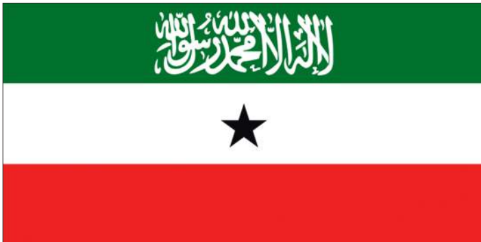
Государственный флаг Сомалиленда (с 1996)

арабском языке; средняя полоса белая, с черной равносторонней пятиконечной звездой в центре; нижняя полоса ярко-красного цвета» 2 . И на флаге Сомалийского национального движения (до 2001 года), и на современном флаге Сомалиленда, вопреки официальным документам, красная полоса нередко заменяется оранжевой, шахада может отсутствовать.