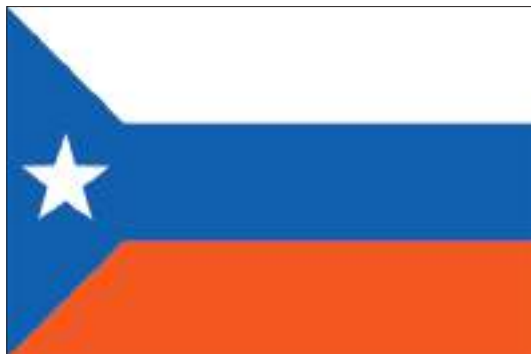
Флаг Ганане (2012)

Власть Азании на территории Сомали опиралась на поддержку кенийских войск, вошедших в Сомали в октябре 2011 года. Вскоре это квазигосударство распалось в результате конфликта между президентом Ганди, которого поддерживала Кения, и местными боевиками во главе с Мадобе, связанными с «кланом» огаден и Фронтом национального освобождения Огадена (в Эфиопии) 9 . Затем Мадобе перешел под покровительство эфиопского правительства, а Ганди был назначен послом Сомали в Канаде. 28 августа 2013 года в Аддис-Абебе было подписано соглашение о признании нового штата Джубаленд в составе Федеративной Республики Сомали. Это соглашение было заключено между федеральным правительством Сомали и временной администрацией Джубаленда, которую возглавлял президент Мадобе.