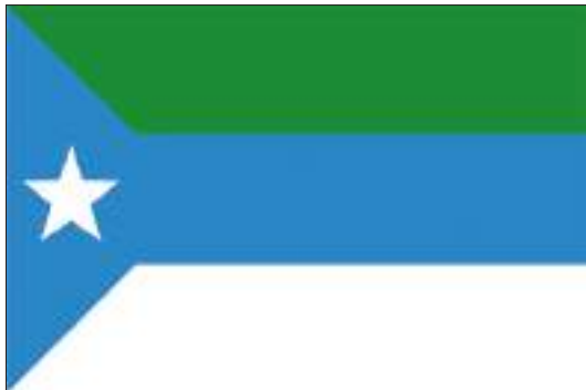
Флаг Джубаленда (по временной конституции 2013 года)

с белой звездой, очевидно, символизирует статус Джубаленда как штата в составе сомалийской федерации. Фактическую самостоятельность Джубаленда поддержал Пунтленд 11 .