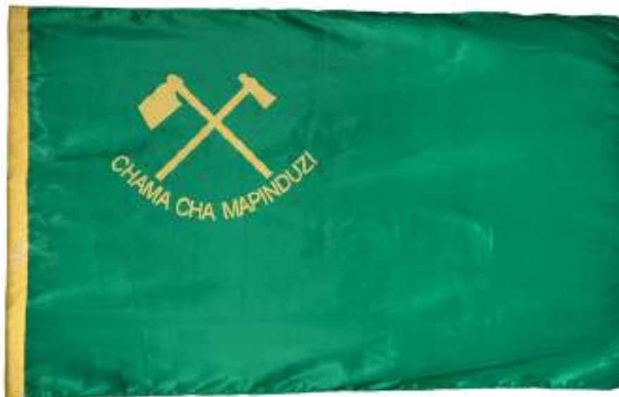
Флаг партии ЧЧМ Государственный Эрмитаж

В государственном флаге Танзании зеленый цвет верхнего треугольника у древка символизирует растительность и сельскохозяйственный потенциал страны, тонкие желтые (золотые) полосы, разделяющие три части знамени (зеленый треугольник, восходящую черную диагональную полосу и синий треугольник у свободного края), обозначают экономическое процветание, богатство недр Танзании полезными ископаемыми. Орудия труда являются местной аналогией серпу и молоту и отсылают к идее единства крестьянства и рабочего класса и изначальной цели партии ЧЧМ – построения в будущем социалистического общества при опоре на собственные силы. Желтая мотыга изображалась и на трехполосном сине-черно-зеленом полотнище флага занзибарской партии Афро-Ширази (Afro-Shirazi Party (ASP); была основана в 1957 году), результатом слияния которой в 1977 году с материковой партией ТАНУ (Африканским национальным союзом Танганьики; Tanganyika African National Union (TANU); был основан в 1954 году) и стала ЧЧМ. Символически мотыга отсылает к теме труда и классовой маркировке партии, призванной защищать интересы рабочего класса (преимущественно африканского по своему составу в противоположность