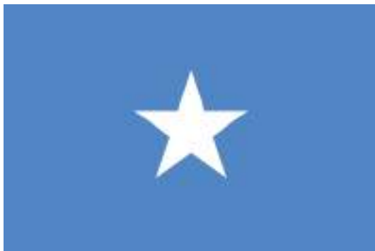
Государственный флаг Сомали

Попытки распространить власть нового государства на соседние территории (Эфиопию, Кению, Джибути) в 1960–1970-х годах не увенчались успехом. В 1969 году в результате военного переворота к власти пришел Мохаммед Сиад Барре.