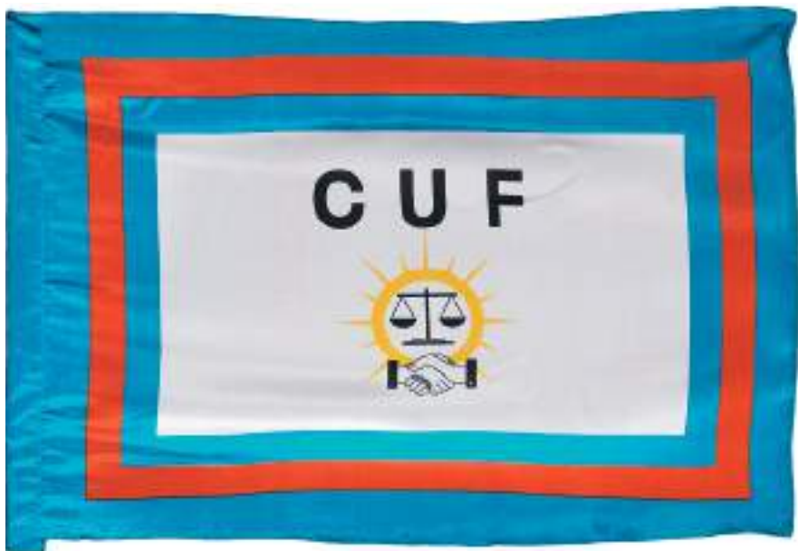
Флаг партии КУФ Государственный Эрмитаж

(в основе которого – флаг Народной Республики Занзибара и Пембы, в крыже – флаг Танзании), то в предвыборной кампании КУФ в 2015 году наряду с партийным знаменем фигурировал флаг Народной Республики Занзибара и Пембы без танзанийского флага в крыже.